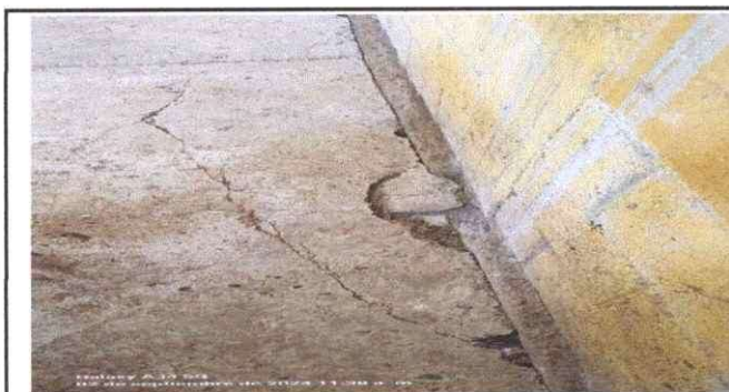
Foto 3: Se observa cambio de concreto torta, por piso de albero foresta