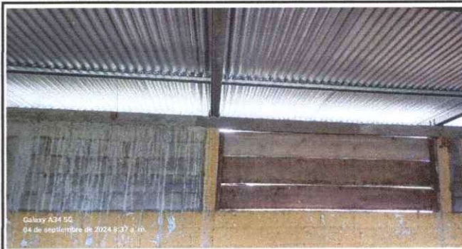
Foto 2: Sustitucion de tablas, por ventana de metal con vidrios. Ya cuenta con cinco hiladas de block.