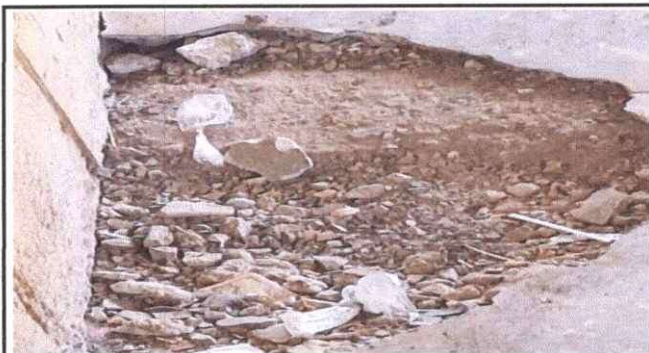
Foto 4: Se observa colocacion de entortado, y despues colocacion de piso de albero foresta en el aula.