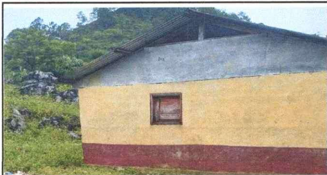
Foto1: Cambio de ventana de madera, por ventana de metal con vidrios